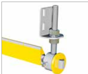
8150 HM Abstreifleiste + Vierkantröhr 8127.