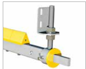
9750 Flexus 2. Adapter 9777 wird ebenfalls benötigt.