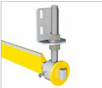
Zubehör: Halter PL und Vierkantrohr 8127, siehe Seite 42 – 43.