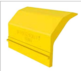
Rasmus Abstreiferblatt im Detail. Komplettlänge Ersatzteil 8342 ist 2,1 – 2,2m.

Für Antriebsrollen mit \varnothing 220-400mm empfohlen.