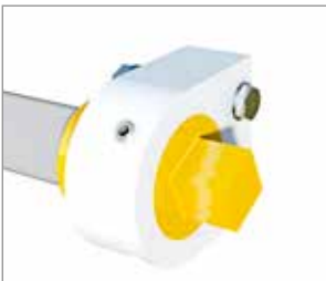
Detail Torsionsfeder für Lebensmittelabstreifer.

Für Antriebsrollen mit \varnothing 100-200mm empfohlen.