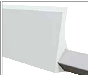
Abstreifblatt Detailansicht mit eingegossenem Träger.