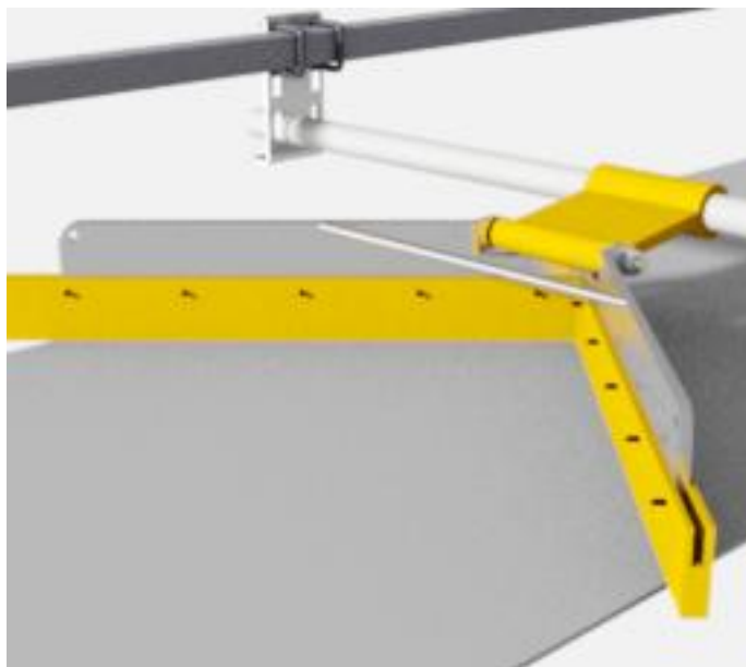
Der MAXI-Pflug mit Vendigs Zubehör MAXI-Klemme 8891 und MAXI-Rohr 8890, am Band montiert.

Wechseln Sie die Pflugleisten indem Sie die Stellschrauben entfernen, die sie an dem elektrogalvanisierten Stahlrahmen halten. Montieren Sie neue Pflugleisten am Rahmen.